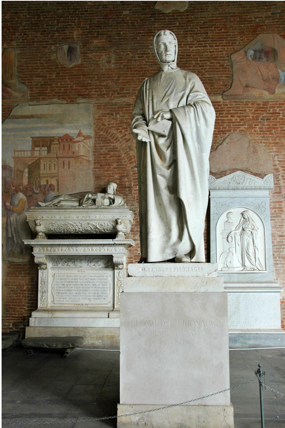
Figure 2 : Statue de Leonardo da Pisa (dit Fibonacci), par Giovanni Paganucci (1863), sur le Camposanto de Pise