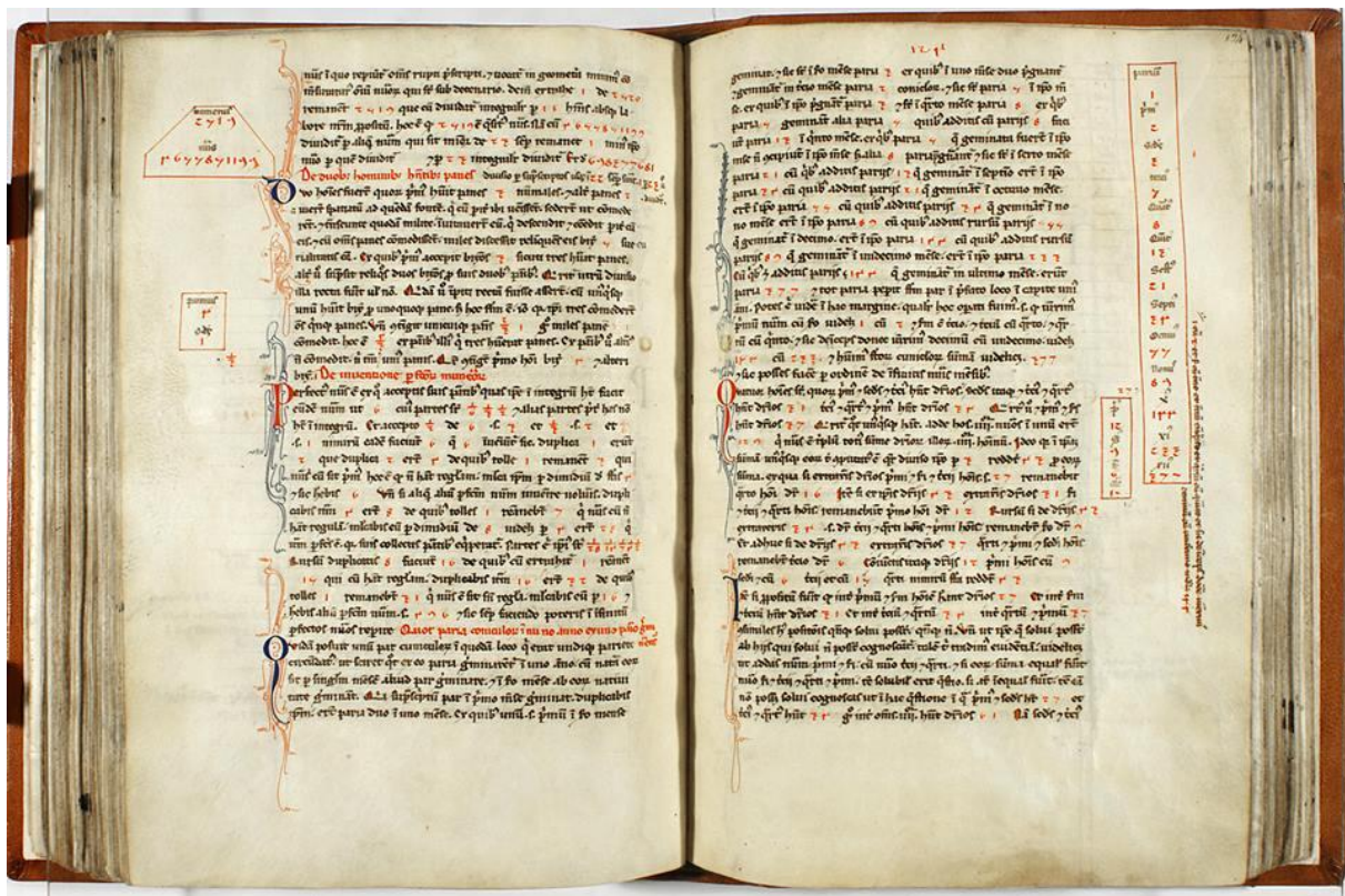
Figure 1 : Extrait du Liber Abaci , département des manuscrits de la Biblioteca Nazionale Centrale di Firenze ( lien ; 214 pages reliées, 29,8*20,8 cm). Sur la page de droite, c'est le paragraphe consacré aux « suites de Fibonacci », avec détail ci-dessous, figure 1bis . La suite est 1, 2, 3, 5, 8, 13, 21, 34, 55, 89, 144, 233, 377, 610 (chaque nombre est la somme des deux qui le précèdent) – la graphie des chiffres n'est pas celle que nous connaissons : le 3 ressemble à un Z, le 5 à un 7, le 4 est difficilement descriptible...

Le titre dit ensuite que le livre a été « composé par Léonard, fils de Bonaccio, Pisan » ( compositus a leonardo filio Bonacij Pisano ). Le nom Fibonacci n'y apparaît donc pas, quand bien même c'est dans cet ouvrage, au folio 123 du manuscrit, que commence le problème des lapins dont est issue la célèbre « suite de Fibonacci ». D'ailleurs comme on va le voir, ce nom n'apparaît nulle part à l'époque de Léonard.