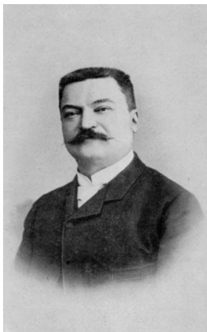
Figure 5 : Édouard Lucas (1842-1891)

C'est le mathématicien Édouard Lucas (1842-1891), spécialiste de la théorie des nombres, qui a élevé ce calcul au rang d'objet mathématique à la fin du XIX e siècle, sous le nom de suite de Fibonacci : si le nombre qui correspond à l'étape n est noté F_n ( F étant choisi pour signifier nombre de Fibonacci ), les nombres suivants de la suite seront donnés par la formule de récurrence F_{n+2} = F_{n+1} + F_n .