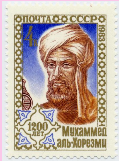
Figure 3 : Timbre de 4 kopeks édité par l'URSS en 1983 pour le 1200 e anniversaire (préssumé) de la naissance d'Al Khowarizmi. On remarque que les Russes lui mettent un o comme c'est l'habitude en français, au contraire des germanophones et des anglophones qui escamotent cette lettre ; mais qu'en revanche est absent le wa , son arabe à la transcription hasardeuse dans toutes les langues occidentales.

Il est vrai qu'il serait plus cohérent, au vu des conventions qui se sont établies peu à peu sur la transcription des noms de lieux de cette région, d'écrire Al Khwarizmi comme le fait Allard 11 , puisqu'on écrit dorénavant Khwarezm pour sa ville ou sa région d'origine (mais il faut bien dire qu'on voit aussi, quoique plus rarement, Khorezm ... où le o réapparaît !). Les Allemands ont moins de problèmes : ils écrivent le plus souvent Al Chwarizmi pour l'homme et Chwarizm 12 pour son origine (mais le traducteur de Juschkewitsch a choisi Choresm 13 ; on tourne en rond !).