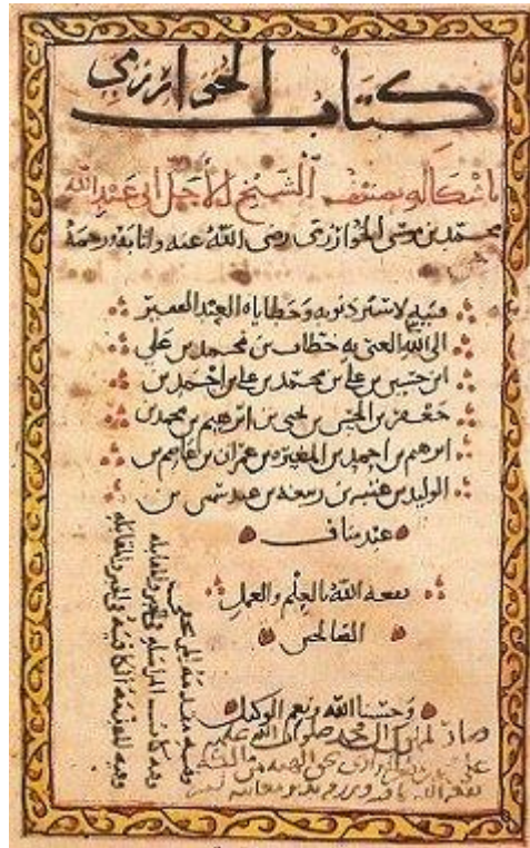
Figure 6 : 1 e page du traité al-mukhtaṣar fī ḥisāb al-jabr wa-l-muqābala , Al Khowarizmi, v. 813-830