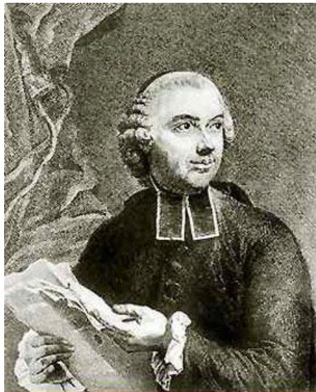
Figure 2 : Étienne Bonnot de Condillac, abbé de Mureau, philosophe français (1715-1780).

Mais puisque nos sensations et toutes nos idées qui en résultent ne sont, comme l'a démontré Condillac, que des modifications intérieures de notre être, puisqu'en elles-mêmes elles n'ont rien qui nous indique d'où elles nous viennent, comment apprenons-nous à les rapporter aux êtres qui en sont les causes occasionnelles ? Comment acquérons-nous la connaissance de ces êtres ? Voilà un second fait à expliquer. C'est la question que je me propose de traiter, parce que je ne la crois pas encore résolue, et parce que sa solution est nécessaire pour compléter l'analyse de l'entendement. Je me flatte d'éclaircir ce point important.