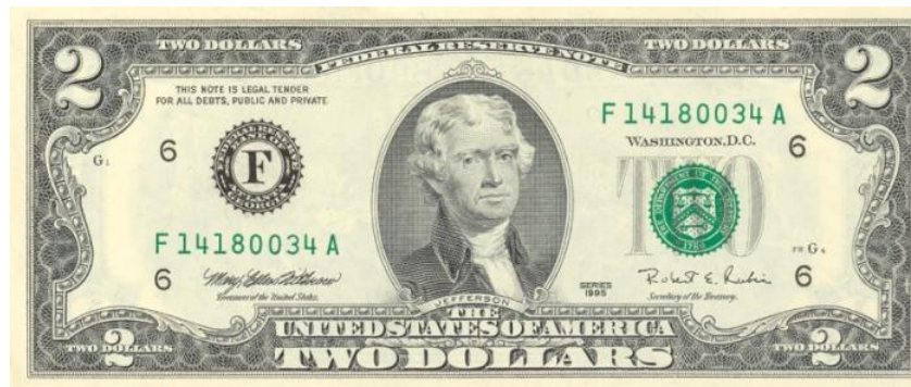
Figure 5 : Thomas Jefferson (1743-1826), philosophe et troisième président des États-Unis (de 1801 à 1809) (ici représenté sur le billet de 2$)

Car Destutt de Tracy a eu une correspondance suivie avec le troisième président d'Amérique, Thomas Jefferson, dont il avait fait la connaissance alors que ce dernier était ambassadeur en France, de 1785 à 1789. Et c'est en s'inspirant des écrits de Destutt de Tracy que Jefferson organisera l'université de Virginie.