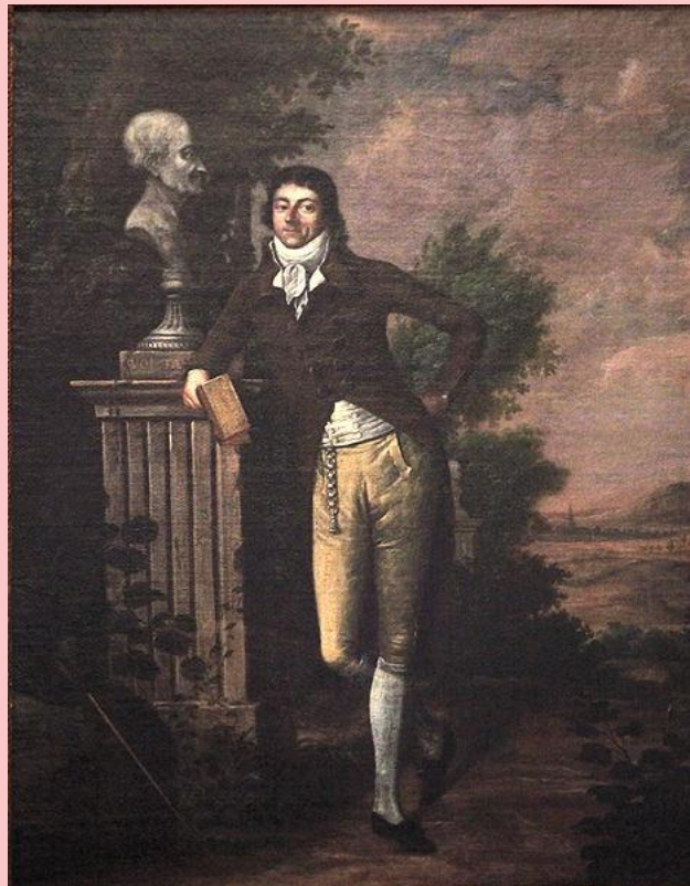
Figure 4 : Dominique-Joseph Garat (1749-1833), philosophe et homme politique - peint par Dryander (tableau au château de Vizille, Isère ;).

Garat, publiciste avant la Révolution – il est rédacteur au Mercure de France –, devient député de son Pays basque natal. Il est ministre de la