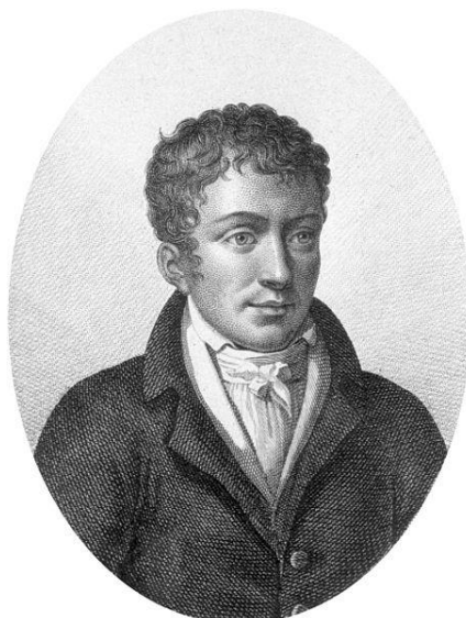
Figure 3 : Pierre-Jean-Georges Cabanis (1757-1808), médecin, physiologiste et philosophe.