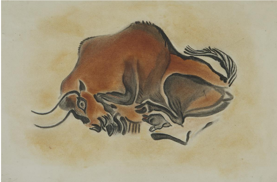
Figure 4 : Bison rupestre d'Altamira relevé par Breuil (in Cartailhac & Breuil, La caverne d'Altamira à Santillane près Santander (Espagne), Monaco, 1906)