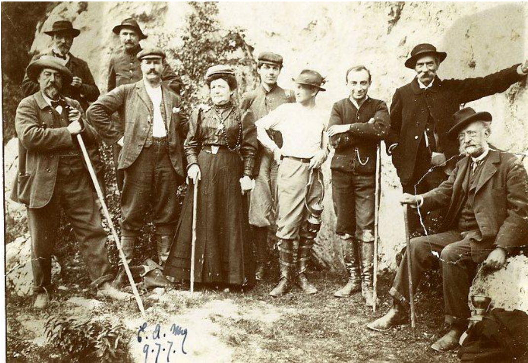
Figure 1 : Émile Cartailhac (assis à droite) et Henri Breuil (3 e en partant de la droite) à l'entrée de la grotte ornée de Gargas (Hautes-Pyrénées) en juillet 1907.

La présentation le 26 juin 1903 d'une note conjointe avec Émile Cartailhac (1845-1921) à l'Académie des inscriptions et belles-lettres sur « Les peintures préhistoriques de la grotte d'Altamira à Santillana (Espagne) 1 » marque, pour Breuil et la science, une étape décisive dans cette marche.