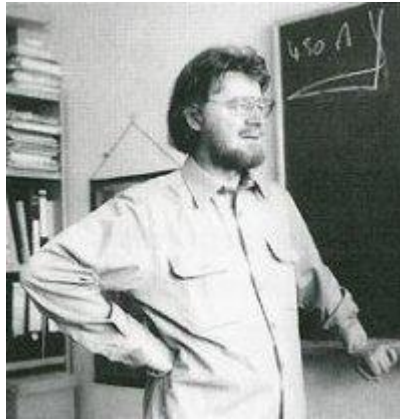
Figure 1: John Stewart Bell (1928-1990). En 1964, Bell publia un article "On the Einstein-Podolsky-Rosen paradox" qui ouvrit une nouvelle vision sur la mécanique quantique et sa place dans le monde.

Je crois pouvoir affirmer que personne ne comprend la Mécanique Quantique (Richard Feynman)