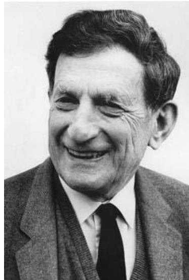
Figure 2: David Bohm (1917-1992), physicien quantique américain.

L'article EPR portait sur la position et le moment de deux particules identiques, émises par une particule au repos. En 1950, David Bohm 3 donna une description plus succincte du même problème en recourant au spin de deux particules émises par une particule de spin zéro (le spin est le moment angulaire intrinsèque de la particule). La simplification vient de ce que les mesures de la position et du moment amènent à des variables continues, tandis que la mesure du spin d'une particule ne fournit qu'un nombre très limité de résultats : pour un électron les résultats sont +\frac{1}{2} ou -\frac{1}{2} , pour un photon ce sont +1 ou -1 .