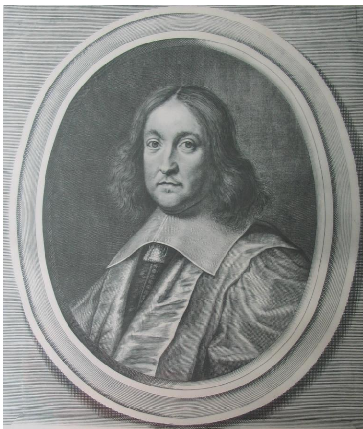
Figure 1 : Pierre de Fermat (ca 1601-1665) (gravure de François Poilly, 1623-1693).

Pour bien se rendre compte des talents arithmétiques de Fermat, voici l'étude de deux de ses lettres, chacune datant de 1643, dans lesquelles il factorise des entiers à 10 et 12 chiffres.