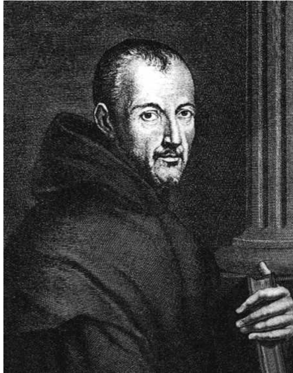
Figure 2 : Le père Marin Mersenne (1588-1648)